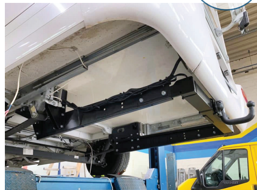
Nachrüstung einer Anhängerkupplung.

EVELS Karosserie- und Fahrzeugbau GmbH Harkortstraße 12 D-48163 Münster