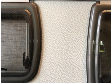
Reparatur und Strukturnachbildung.

mobilen kostengünstig wieder instandgesetzt werden. Bis zu einem Schadensbild von 32x8 cm können wir diese Methode anbieten. Ob eine Strukturnachbildung oder Lackreparatur, wir können Ihnen nach einem Beratungstermin gerne die richtige Reparaturmethode anbieten. Bei weiteren Fragen können Sie sich telefonisch oder per E-Mail mit uns in Verbindung setzen.