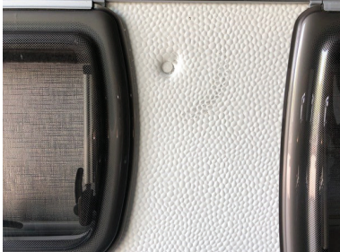
Delle in strukturierter Seitenwand.