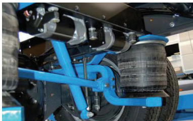
Luftfederung für Wohnmobile.