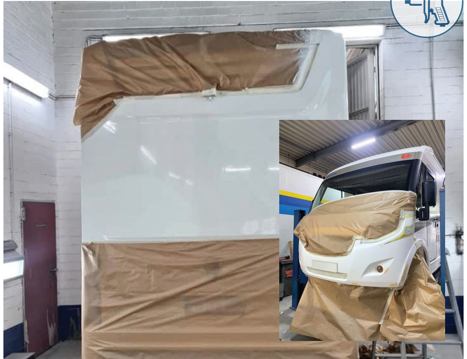
Teilersatzreparatur der Sandwichwand an einem Wohnmobil.