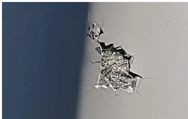
Schaden an Seitenwand.

Als Ihr geprüfter Caravan-Fachbetrieb haben wir nicht nur eine jahrelange Erfahrung, sondern auch die Kompetenz im Umgang mit modernen Fahrzeugen und deren verbauter Technik. Reparatur statt Austausch ist auch hier unsere Devise. Für Sie bedeutet das, dass der Unfallschaden fachgerecht repariert wird. Teure Ersatzteile oder komplette Seitenwände werden nicht benötigt und die Reparaturkosten werden um einige tausend Euro preiswerter ausfallen. Gerne bieten wir im Rahmen der Möglichkeiten auch eine Teillackierung für Sie an. Wir beraten Sie gerne. + (49 (0) 251-322631-0)