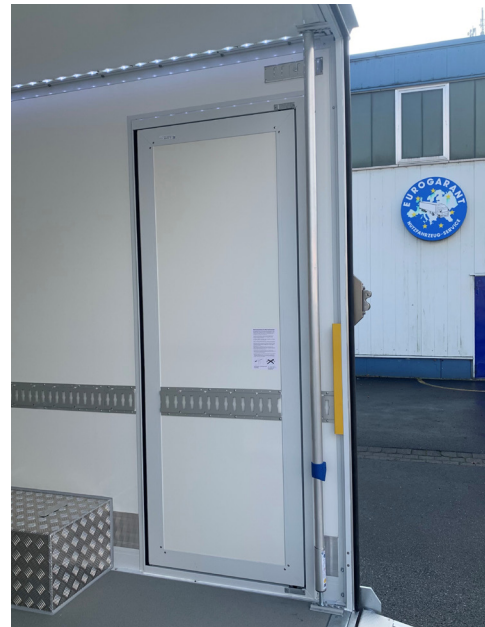
BÄKOLiner Seitentür & Parkposition.

Die besonders niedrige Ladekante ermöglicht das Be- und Entladen per falt- oder drehfedergestützter Heckladerampe. Die serienmäßige Heckklappe bietet einen perfekten Witterungsschutz. Durch die erhöhte Sockelleiste wird der Laderaum zusätzlich geschützt. Die vielseitigen Absperssysteme schützen Ihre Ware optimal.