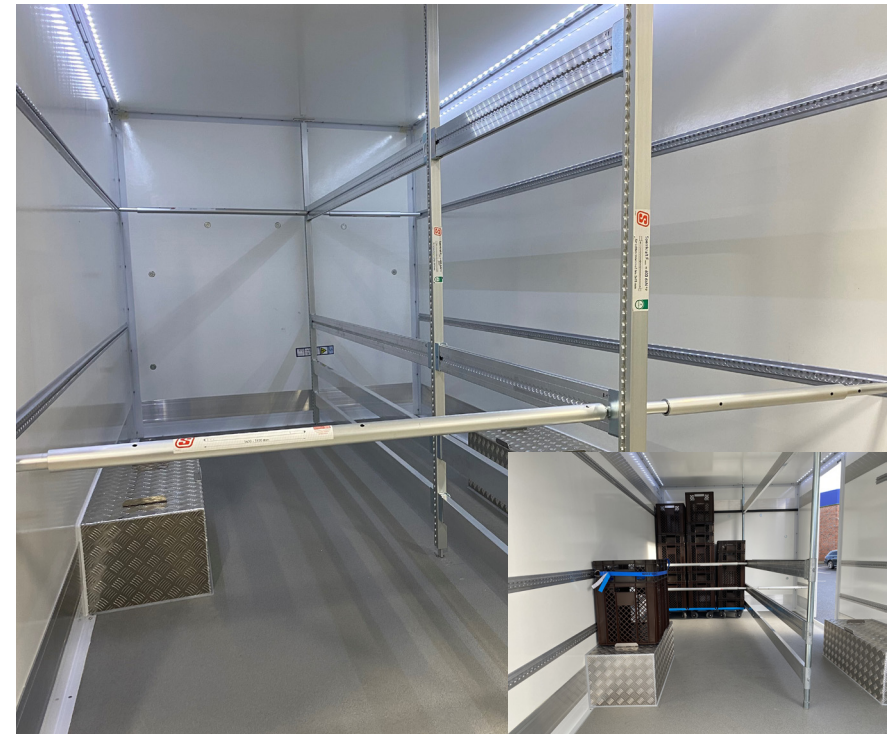
Filialeinteilung „XL“ und „Standard“ nach Kundenwunsch.

Zur Filialeinteilung können wir Ihnen unser neuestes Trennsystem mit bis zu 3 Gassen empfehlen. Die Aufteilung und Ausrichtung der passenden Trenn-/ Absperrlösung können wir nach Ihren Wünschen anpassen. Die Einteilung lässt sich sowohl herausnehmbar, als auch fest verbauen. Nennen Sie uns einfach die Abmessungen Ihrer Ladegüter, um Ihre Wunscheinteilung erfüllen zu können. (siehe Rückseite)