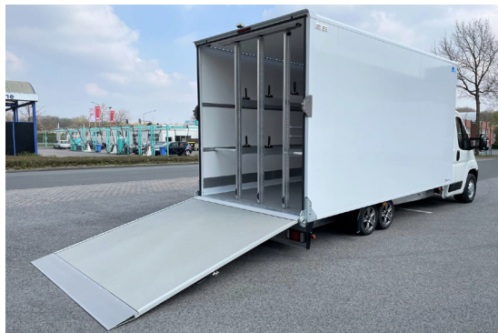
BÄKOLiner auf Alu Tiefrahmen-Chassis.