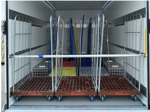
Beladungsbeispiel mit 13 Rollwagen.