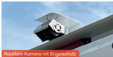
Rückfahr-Kamera mit Bügelschutz