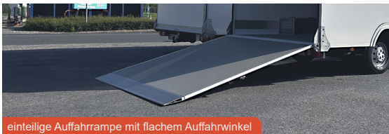
einteilige Auffahrrampe mit flachem Auffahrwinkel