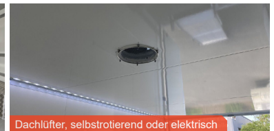
Dachlüfter, selbstrotierend oder elektrisch