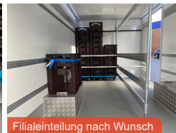
Filialeinteilung nach Wunsch